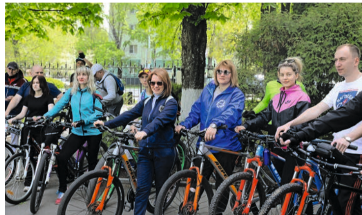
Велокоманда комбината КМАруда растет!

Дистанция 18 километров – любительский уровень, в сезон ежедневно проезжаем по 70–80 км. Здесь не ради рекордов: дружелюбная компания единомышленников, новые лица, знакомства.