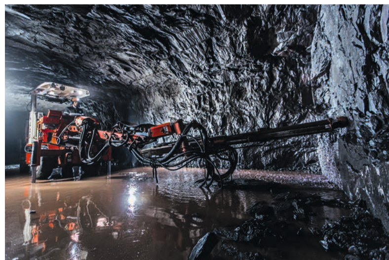
С начала 2023 года в шахту поступило 10 новых буровых установок.